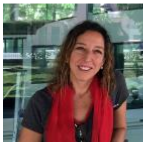
Editorial N.º2, por Nerina Visacovsky