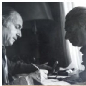
Un pequeño tesoro en el CeDoB: papeles personales de Alberto Gerchunoff