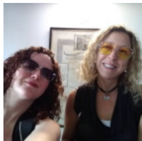
Editorial N.º 12: ¡El gusto es nuestro! por el Equipo del CeDoB Pinie Katz