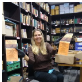
Hermann Ludwig. Música y teatro en el exilio por Silvia Glocer